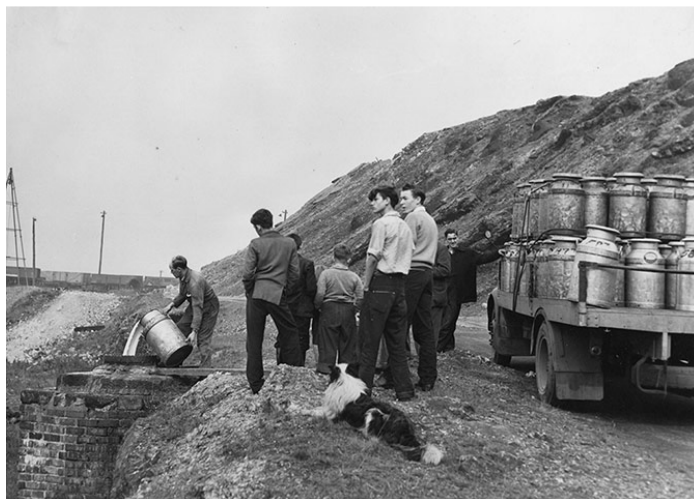
Obrázek 3: Vylévání mléka do kanálů v okolí Windscale

Ve Windscale po havárii JZ došlo k významnému úniku radionuklidů (Wolf, 1959), nejvýznamnějším byl ^{131}\text{I} . Protože k havárii došlo 10. října, jednalo se o zemědělskou oblast a krávy byly v této roční době na pastvinách, došlo k velkému přestupu radionuklidů do zvířat jak inhalačně, tak i ingesční cestou přes kontaminovanou pastvu. Došlo tedy také k velkému přestupu radionuklidů do mléka. Britské úřady stanovily mez pro používání mléka pro lidskou spotřebu na 0,1 \mu\text{Ci } ^{131}\text{I} / \text{l} , tj. 3700 \text{ Bq } ^{131}\text{I}/\text{l} . Protože velké množství mléka tuto mez překračovalo, přijaly jako opatření pro jeho likvidaci vylévání kontaminovaného mléka do kanálů anebo rozlévání na půdu (hnojení mlékem). Takto bylo zlikvidováno 250 000 galonů, tj. 1,1 \cdot 10^6 litrů mléka od 600 stád krav na území 200 – 300 čtverečních mil, tj. 320 – 480 \text{km}^2 . Délka tohoto opatření byla po dobu 2 – 3 týdnů, v souvislosti s poločasem rozpadu ^{131}\text{I} . Na obrázku č. 3 je ukázán příklad vylévání mléka do kanálu.