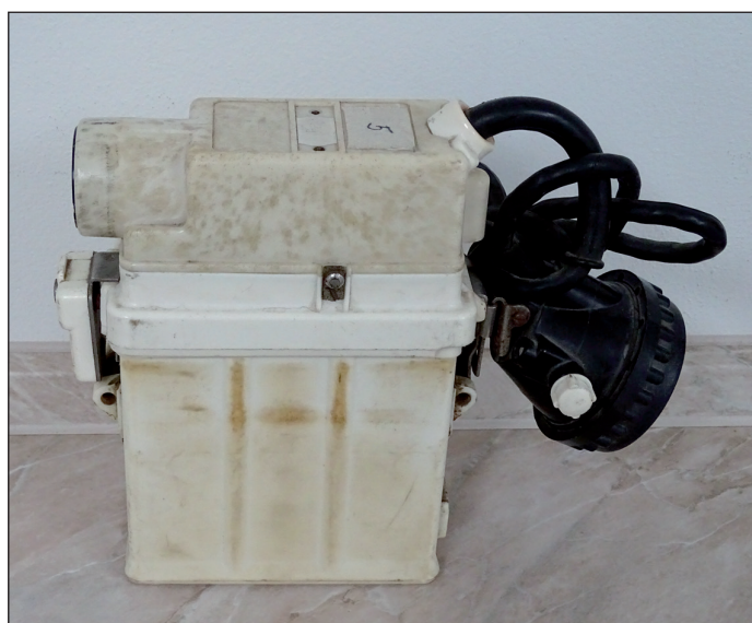
Osobní dozimetr OD88