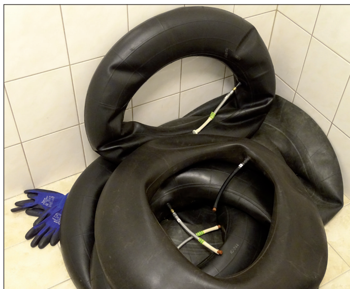
Originální metoda odběru radonu

Nejsme moc velká a mohovitá země. Přesto si dovoluujeme tvrdit, že držíme krok s jinými. Kdyby chtěli, dokonce by se u nás mohli poučit.