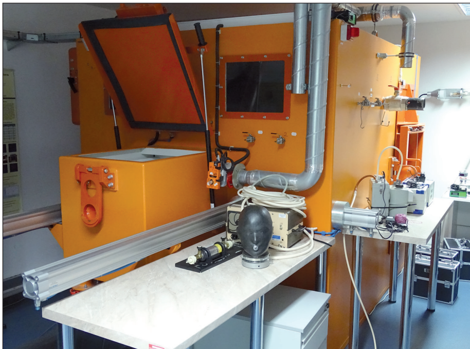
Radon – aerosolová komora