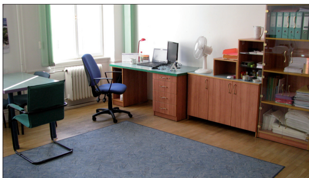
Příklad pracoviště v budovách

Současné platí, že pokud byla na jakémkoliv pracovišti v ČR zjištěna objemová aktivita radonu nad 300 \text{ Bq/m}^3 , je toto pracoviště, přestože neodpovídá žádné z výše uvedených charakteristik, rovněž považováno za pracoviště s možným zvýšeným ozářením z radonu.